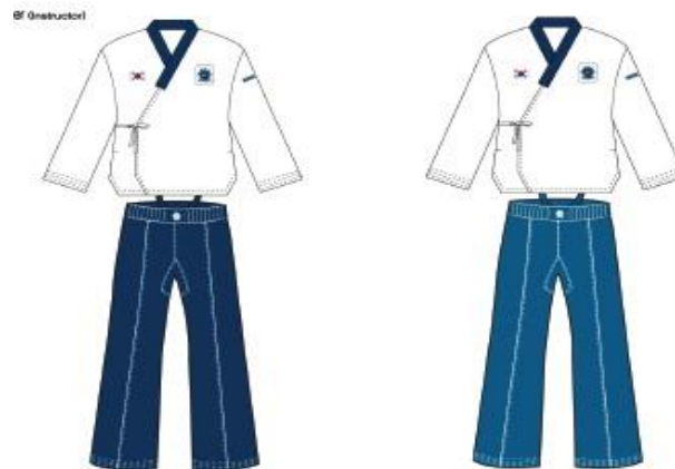
Masculino Chaqueta Blanca + Pantalón Azul Oscuro / Femenino Chaqueta Blanca Pantalón Azul Claro