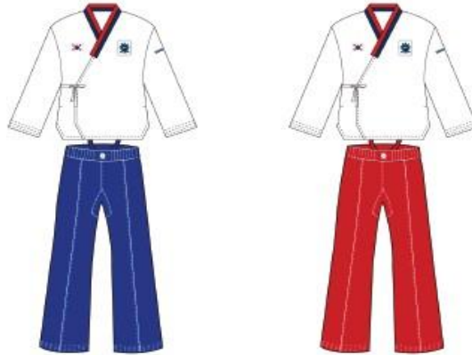
Masculino Chaqueta Blanca (cuello rojo / negro) / Femenino Chaqueta Blanca (cuello rojo / negro) + Pantalones Azules / + Pantalones Rojos