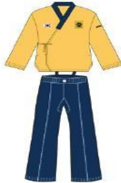
Masculino & Femenino: Chaqueta Amarilla + Pantalón Azul Oscuro